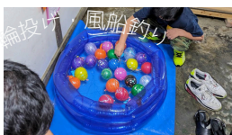
ワールドファミリー