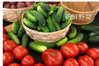
新鮮野菜 カネサダ