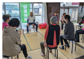
一久師匠の健康体操