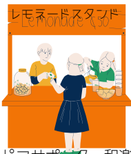
ピアサポーター和楽