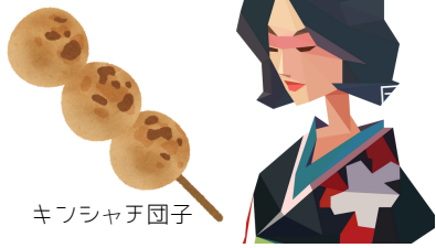
キョウシャチ団子 リメイクサロン「和」