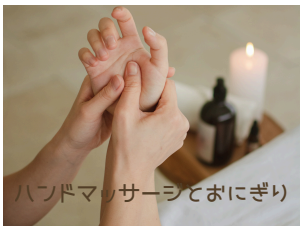
ハンドマッサージとおにぎり for mee