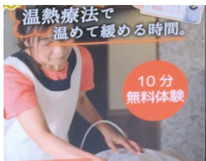
和漢薬房 10分 無料体験