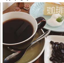
珈琲 ぱっちあーく