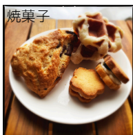
焼菓子 パイズリー