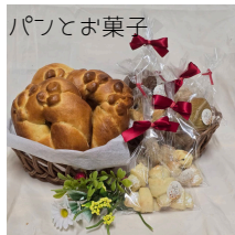
パンとお菓子 グレース デ カフェ