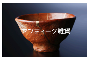
アンティーク雑貨 藍新~AIScene