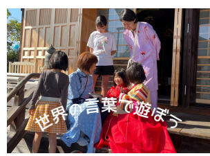
世界の言葉で遊ぼう ヒッポファミリークラブ