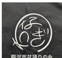
稲沢市盆踊りの会 あつなぎ