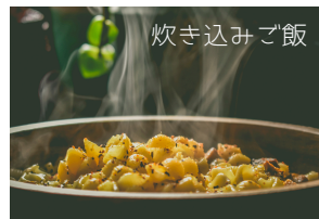
炊き込みご飯 小梅本店